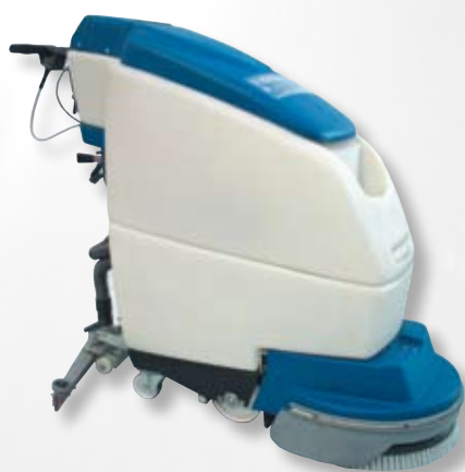
D43ET - D43BT - D50ET - D50BT