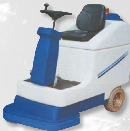
SM70B - SM80B