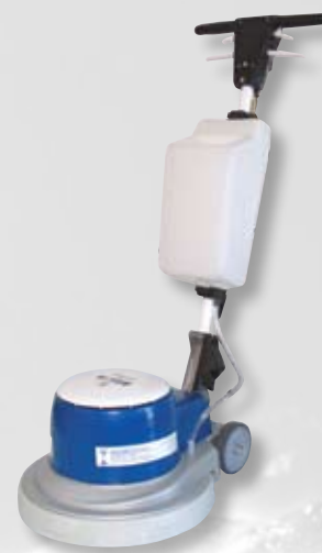
M13- M17 - M21